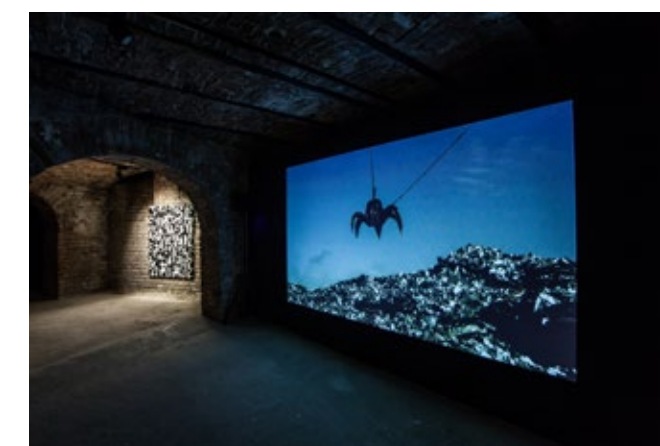
Tania Mouraud—OTNOT, Eastwards Prospectus, 2016, imagini din expoziție. Foto: Alex Nelu/installation views. Photo: Alex Nelu