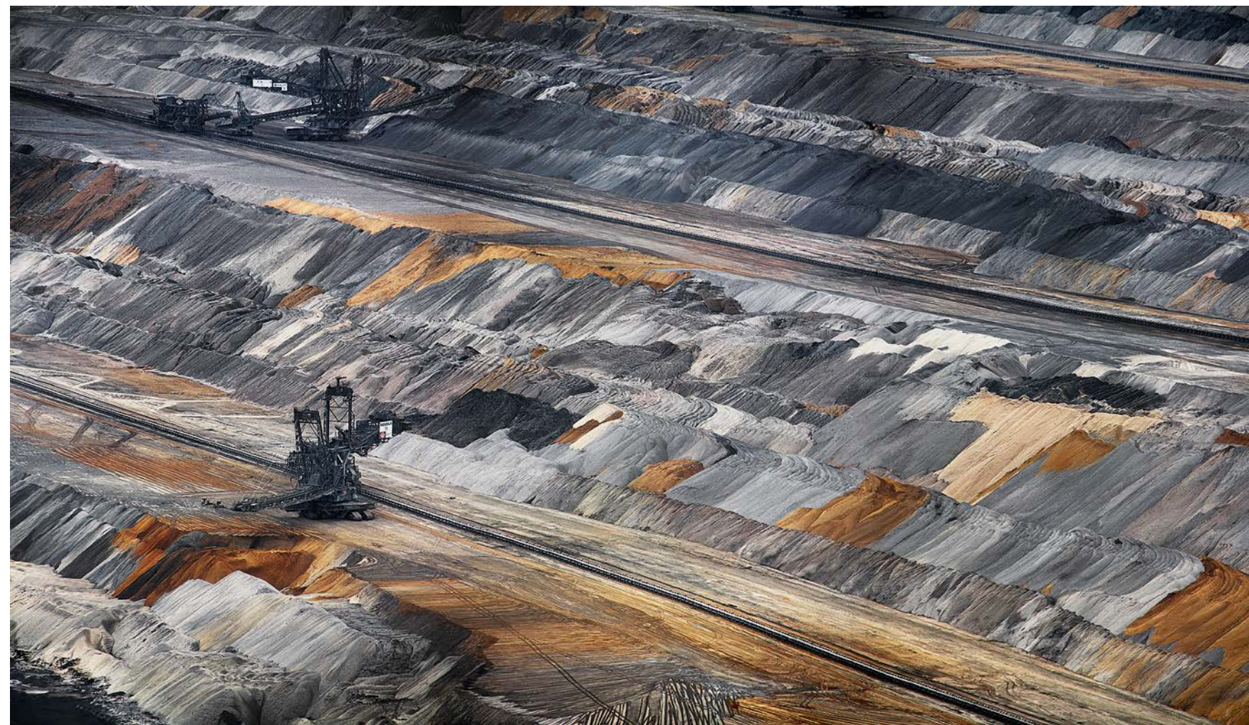
PRIMA PAGINĂ Tania Mouraud, Borderland 0683 , 2010, cerneală pigment pe hârtie Fine Art, ©Tania Mouraud, ADAGP